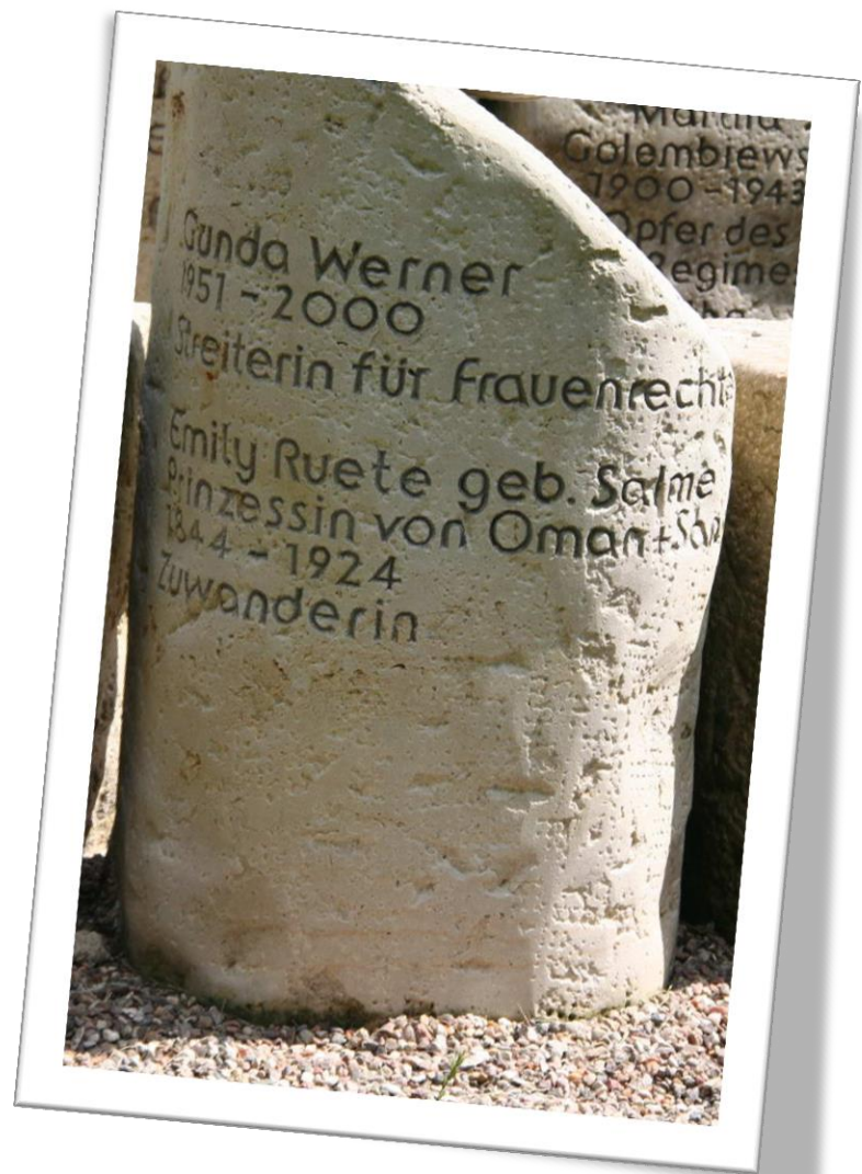
Gedenkstein für Emily im „Garten der Frauen“