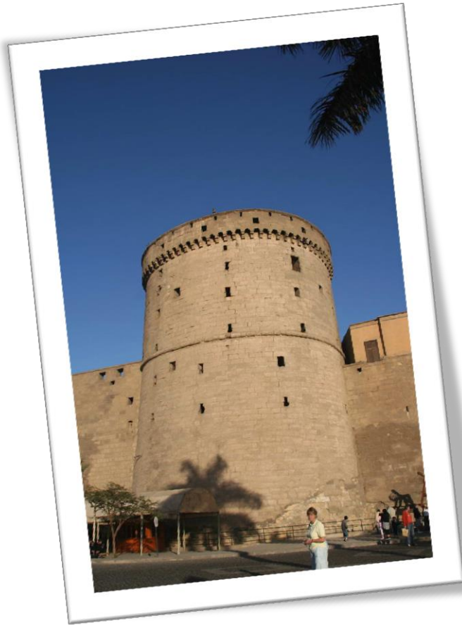
Zitadelle von Cairo