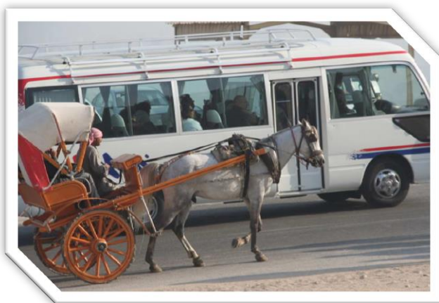
Auf Cairos Straßen