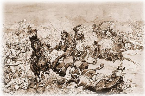
Schlacht von El-Teb - Le Monde Illustré, 1844

3.342 Infanteristen, Kanoniere und Sappeure und 864 Kavalleristen standen sich in dieser zweiten Schlacht geschätzten 15.000 Männern des Mahdi gegenüber; 5 britische Offiziere und 24 Soldaten verloren ihr Leben, 17 Offiziere und 142 Soldaten wurden verwundet. Auf Seiten der Mahdisten starben geschätzte 2.500 Mann; die Zahl der Verwundeten ist unbekannt.