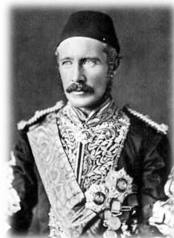
General Charles Gordon, ca. 1883