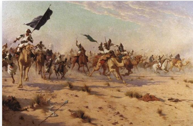
Flucht des Khalifa nach der Schlacht von Omdurman, 1898 Robert George Talbot Kelly, ca. 1900

Ebenso wie der Krimkrieg, der in Unter dem Safranmond eine Rolle gespielt hat und der in Jenseits des Nils kurz erwähnt wird, hat der Mahdi-Aufstand hierzulande in unserem Bewusstsein keine Spuren hinterlassen, da beide Kriege ohne deutsche Beteiligung stattfanden.