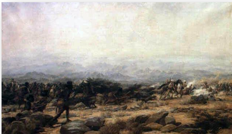
Schlacht von Tamai - Geoffrey Douglas Giles, ca. 1885

Dass sich unter den Mahdisten auch Jungen im Alter von zehn, elf Jahren befanden, ist eine historische Tatsache, und auch Stephens Erinnerung an einen bestimmten Jungen, der ungeachtet seiner Verletzungen hasserfüllt noch nach der Schlacht versuchte, Briten zu ermorden, ist eine verbürgte Episode.