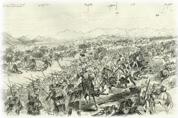
Schlacht von Tamai - Melton Prior, 1884

In der Handlung des Romans hat die Schlacht von Tamai einen etwas undankbaren Platz abbekommen: nach der Schlacht von El-Teb, die für mich wichtig war, weil es in der Chronologie der Ereignisse die erste war, in denen das Royal Sussex in tatsächliche Kampfhandlungen verwickelt war und somit Jeremy, Leonard, Royston, Simon und Stephen das erste Mal mit Todesangst und Töten konfrontiert werden. Aber auch vor der Schlacht von Abu Klea, die bis heute im Gedächtnis der Briten etwas von einer Legende hat, - und diejenige, in der die fünf jungen Männer ihr jeweiliges Schicksal ereilt.