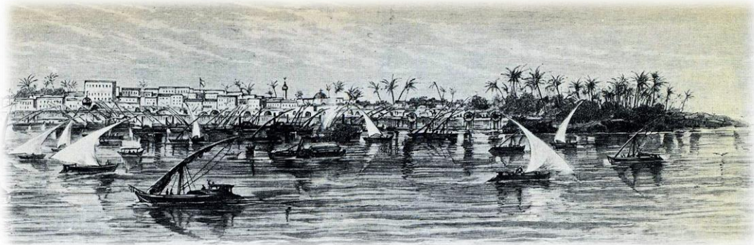
Khartoum - Oberst Colborne, 1880

Denn obwohl die Briten schließlich den Sieg davontrugen, blieb genau das als Symbol für die Vergeblichkeit dieses Krieges, für die Niederlage, die am Ende des Feldzuges stand, zurück: die Zerschlagung des britischen Karrees als Sinnbild für die chaotische, wilde Übermacht der Mahdisten.