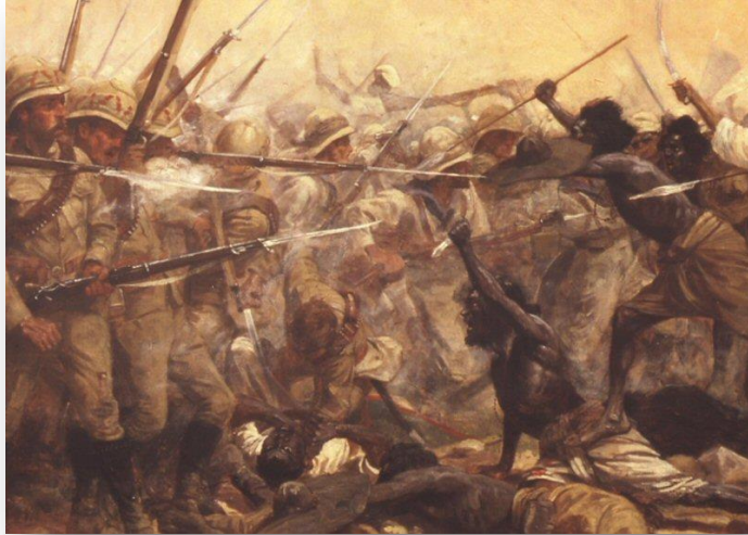
Schlacht von Abu Klea - William Barnes Woollen, frühes 20. Jhdt.

Gemessen an den anderen Schlachten dieses Aufstandes entrichteten die Briten mit einer Truppenstärke von 1.400 Mann in Abu Klea geringen Blutzoll: 71 Männer, darunter 11 Offiziere, wurden getötet und 64 verwundet; drei Soldaten gelten bis heute als vermisst. Geschätzte 14.000 Mahdisten standen ihnen gegenüber, wovon ungefähr 3.000 aktiv angriffen und gut die Hälfte von ihnen getötet wurde.