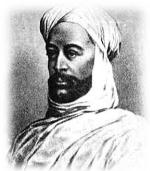
Mohammed Ahmad, der Mahdi

Wenn der Begriff Mahdi dennoch fällt, geschieht dies meist in Zusammenhang mit dem zweiten Feldzug 1896-1899, und dann auch nur in Bezug auf einen Lieutenant, der in diesem Feldzug zwar dabei war, aber erst viel später durch seine politische Aktivitäten, sein Amt des Premierministers und nicht zuletzt durch seinen eigenwilligen Charakter berühmt wurde: Winston S. Churchill.