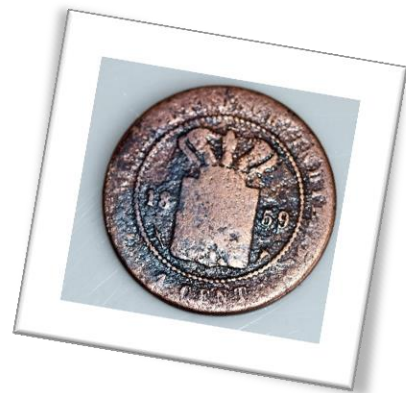
Cent-Münze aus Niederländisch-Ostindien, 1859